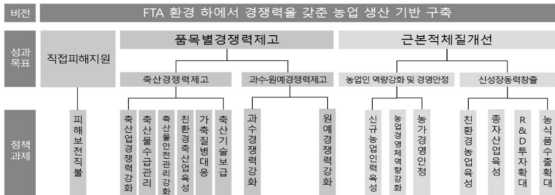
그림 2-1. FTA 국내보완대책 성과목표와 정책과제