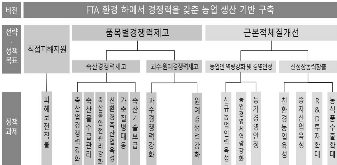
그림 2-1. FTA 국내보완대책 전략·정책목표와 정책과제